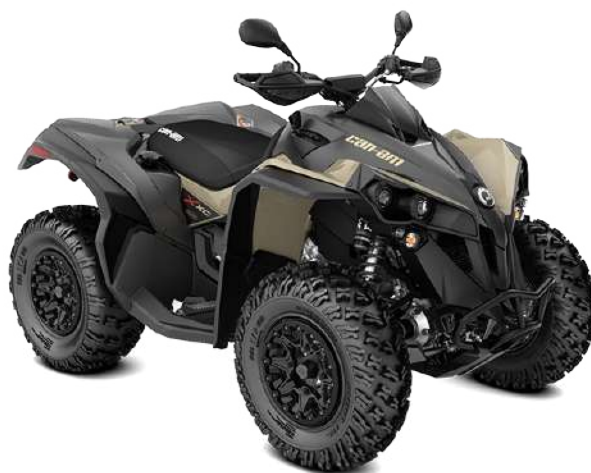
■ Dorado desierto y Negro carbón