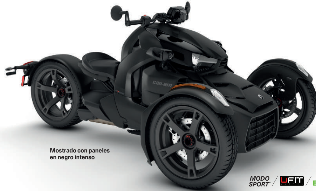
Mostrado con paneles en negro intenso