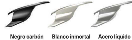
Negro carbón Blanco inmortal Acero líquido