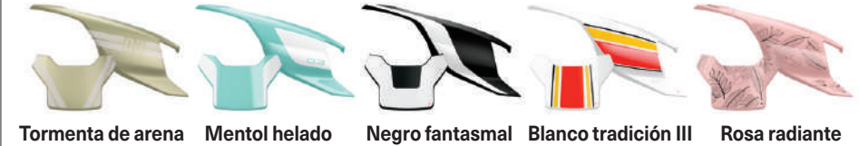
Tormenta de arena Mentol helado Negro fantasmal Blanco tradición III Rosa radiante