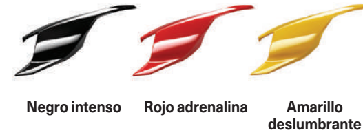
Negro intenso Rojo adrenalina Amarillo deslumbrante