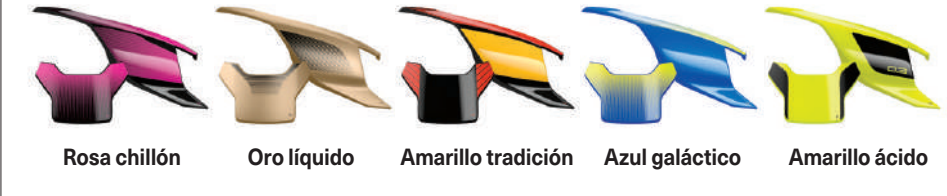
Rosa chillón Oro líquido Amarillo tradición Azul galáctico Amarillo ácido