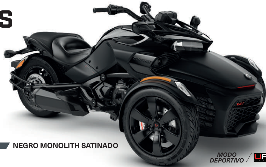
■ NEGRO MONOLITH SATINADO