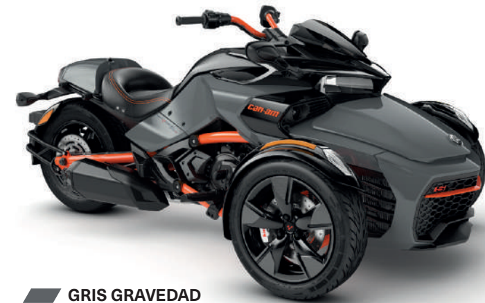
■ GRIS GRAVEDAD SERIE ESPECIAL