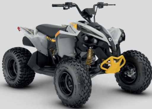
Catalyst Gray & Neo Yellow