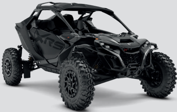
■ Triple Black