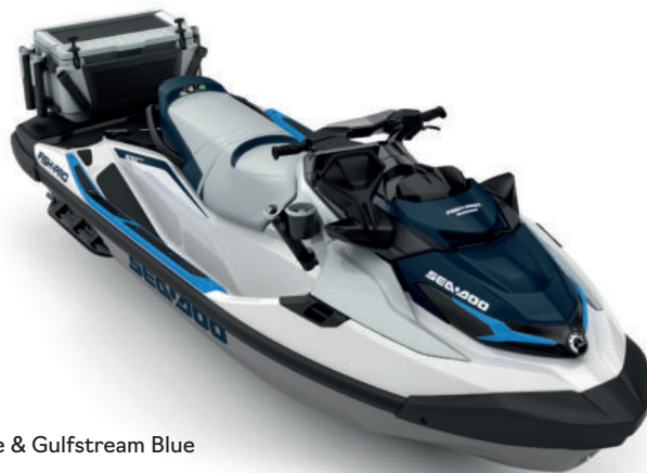
White & Gulfstream Blue