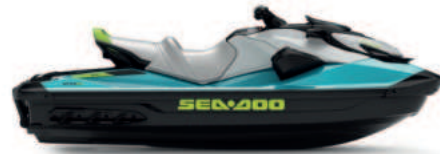
● Teal Blue and Manta Green