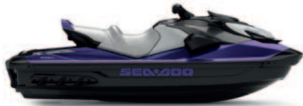
● NEW Midnight Purple