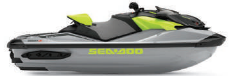
● Ice Metal and Manta Green