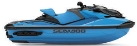
● NEW Gulfstream Blue Premium