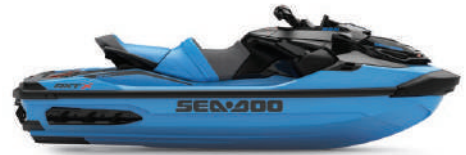
● NEW Gulfstream Blue Premium