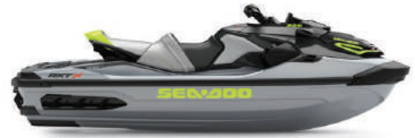
● Ice Metal and Manta Green