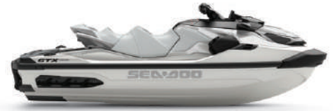
○ White Pearl Premium