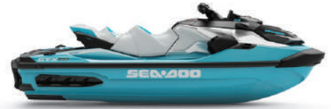
● Teal Metallic